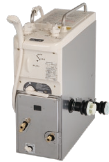
バランス型ふろがまの器具枠つまみ用の樹脂金型。製品設計データを一貫して利用し、樹脂金型の設計期間を短縮し、樹脂部品を増やしていくことで、部品コストを低減できる。